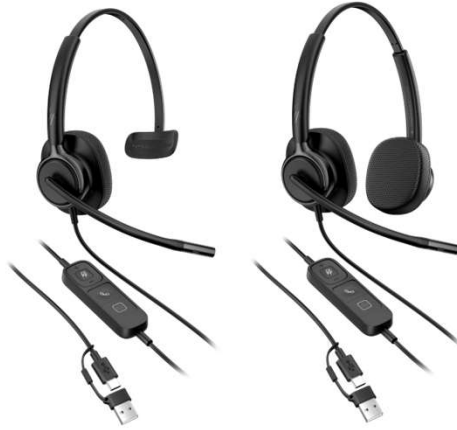
HP Poly Mission 400