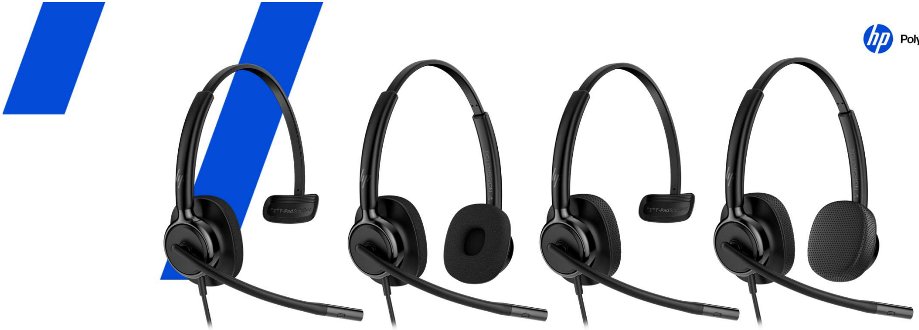
HP Poly Mission 400