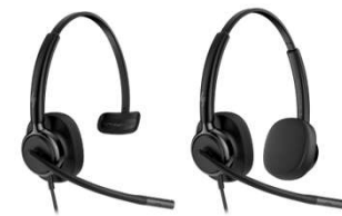
HP Poly Mission 400 Series